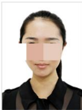
（证件照标准示例照片）