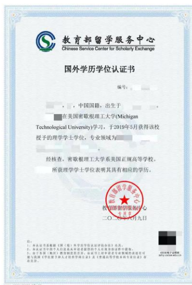
《教育部留学人员服务中心出具学历认证报告》示例

(6) 境外获得学历学位证书的考生, 必须上传教育部留学服务中心出具学历认证报告。