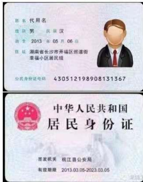
(身份证正反面示例)