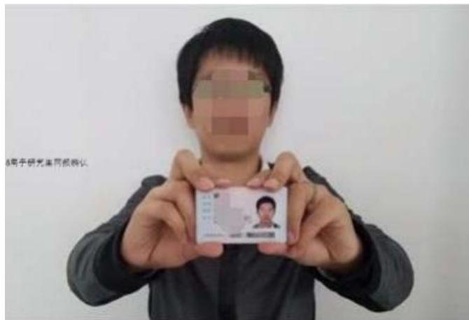
(手持身份证照示例)

①拍摄时，手持本人身份证，持证的手臂和上半身整体拍进照片，头、肩部端正，露出五官，脸部不要有遮挡物或有阴影；