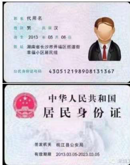
(身份证正反面示例)