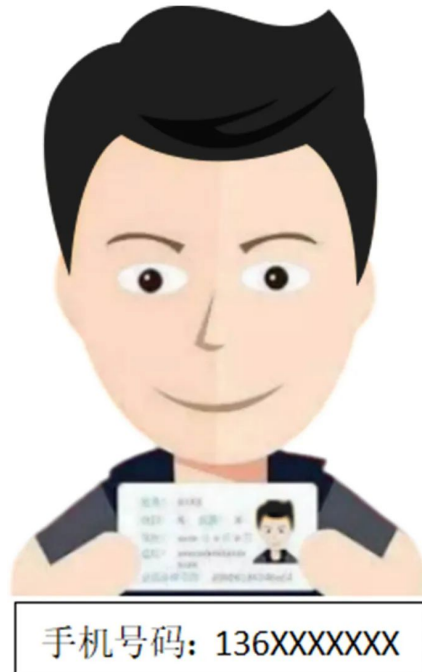
(手持身份证照示例)

①拍摄时，手持本人身份证，持证的手臂和上半身整体拍进照片，头、肩部端正，露出五官，脸部不要有遮挡物或有阴影；