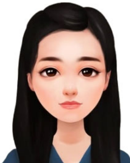
(证件照标准示例照片)